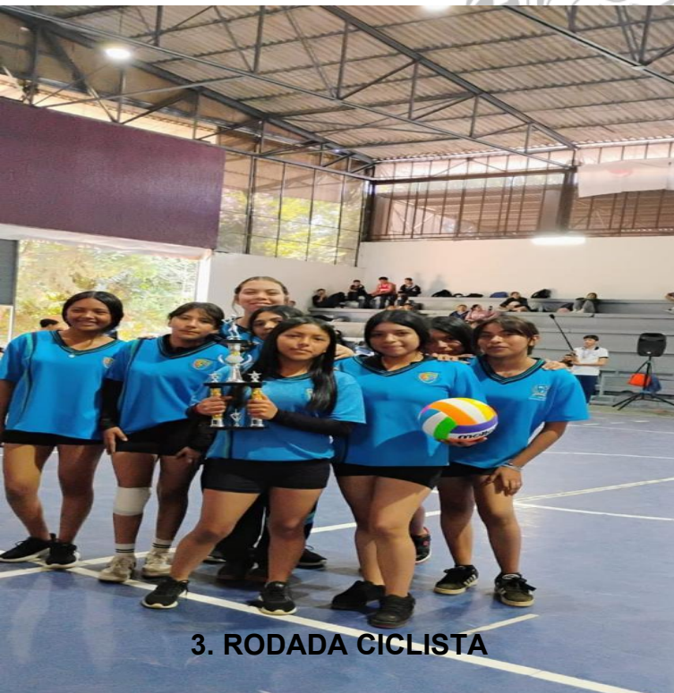
3. RODADA CICLISTA